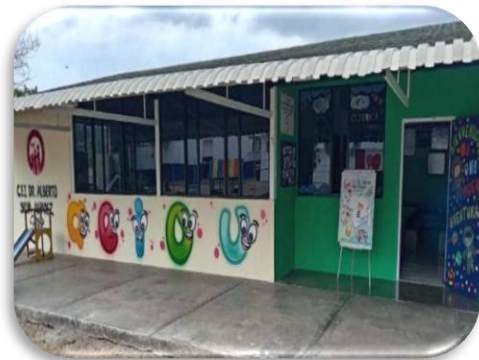
Logo Del CEI Fachada De la Institución