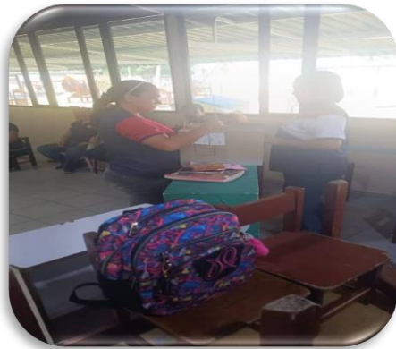
Grupo de trabajo