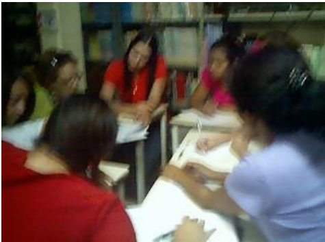
Figura 3. Conclusiones del taller