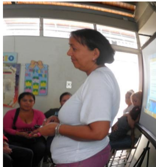
Figura 11. Participación de la ponente