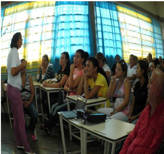
Figura° 10. Taller de Comunicación y emociones

Sobre la promover la comunicación entre el personal directivo – docente para fortalecer integración como una competencia de gestión emocional gerencial. De la misma forma, la ponente hace la invitación a la próxima jornada planificada el día 12 de abril del presente, reiterándole las gracias a los participantes por su asistencia no sin antes recordarles que hay que tomar en cuenta el compromiso de la institución dando por concluido el taller.