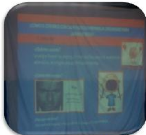
Desarrollo de la Tematica