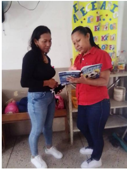
Figura 12. Evaluación de la acción