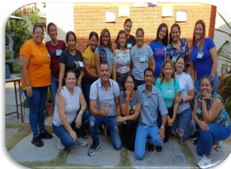
Figura 8. Grupo coordinador de las tareas

Este grupo debe coordinar las tareas y hacer que sus integrantes cumplan con ciertas reglas. El cierre del taller N° 2, estuvo dirigida de los dos profesores presentes. De igual forma, se realizó la invitación a los docentes a la próxima actividad planificada para el 12 de abril 2024, se toma la asistencia, agradeciendo la asistencia y la atención prestada.