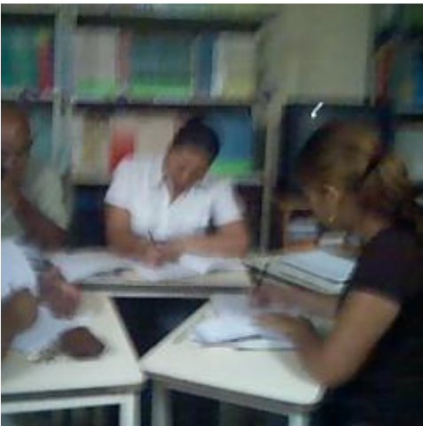
Figura 2. Mesas de Trabajo.