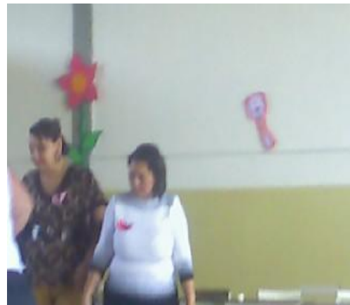
Figura N° 6, intervención de la actividad