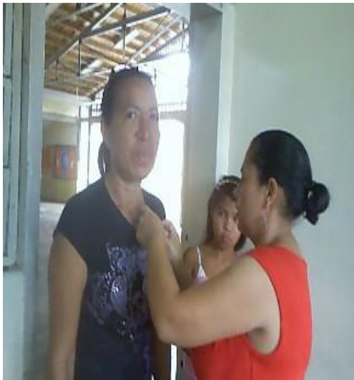
Figura 1. Colocación de distintivos.

asistencia, de los participantes y la investigadora realiza una lectura de reflexión y realiza la petición de la hoja de evaluación. Se invita al próximo taller y proseguirá con la temática.