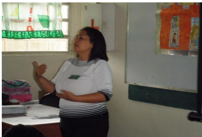
Figura 9 .Ejecución de la actividad

El presente taller se tituló “intercambio comunicacional y cognitivo para el desarrollo del educando en el ámbito emocional.”, el mismo tuvo como objetivo dar cumplimiento a lo planificado para el día 12 de abril de 2024, iniciando a las 9 de la mañana por parte de la Directora, donde amablemente da la bienvenida a los asistentes a la actividad del día.