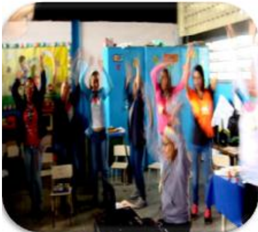
Dinamica de inicio "Gimnasia Cerebral"