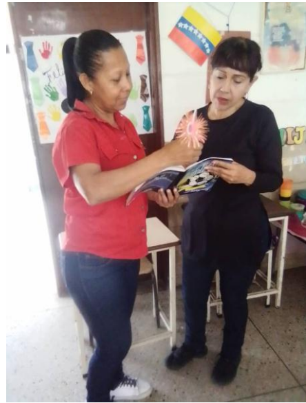
Figura 13. Verificando derivaciones