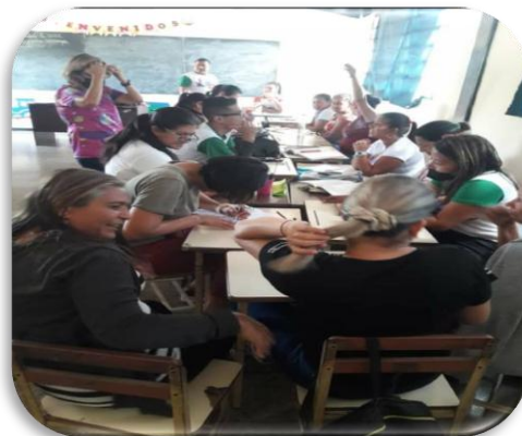
Figura 7. Mesa de trabajo y reflexiones