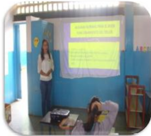
orientaciones para el comienzo del taller