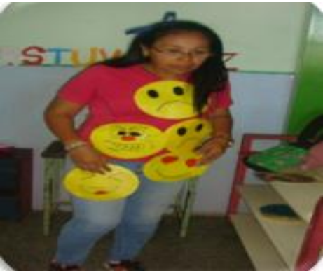
Figura 4. Emociones