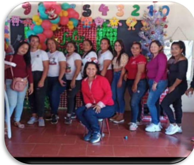
Figura 14. Culminación de la jornada 3