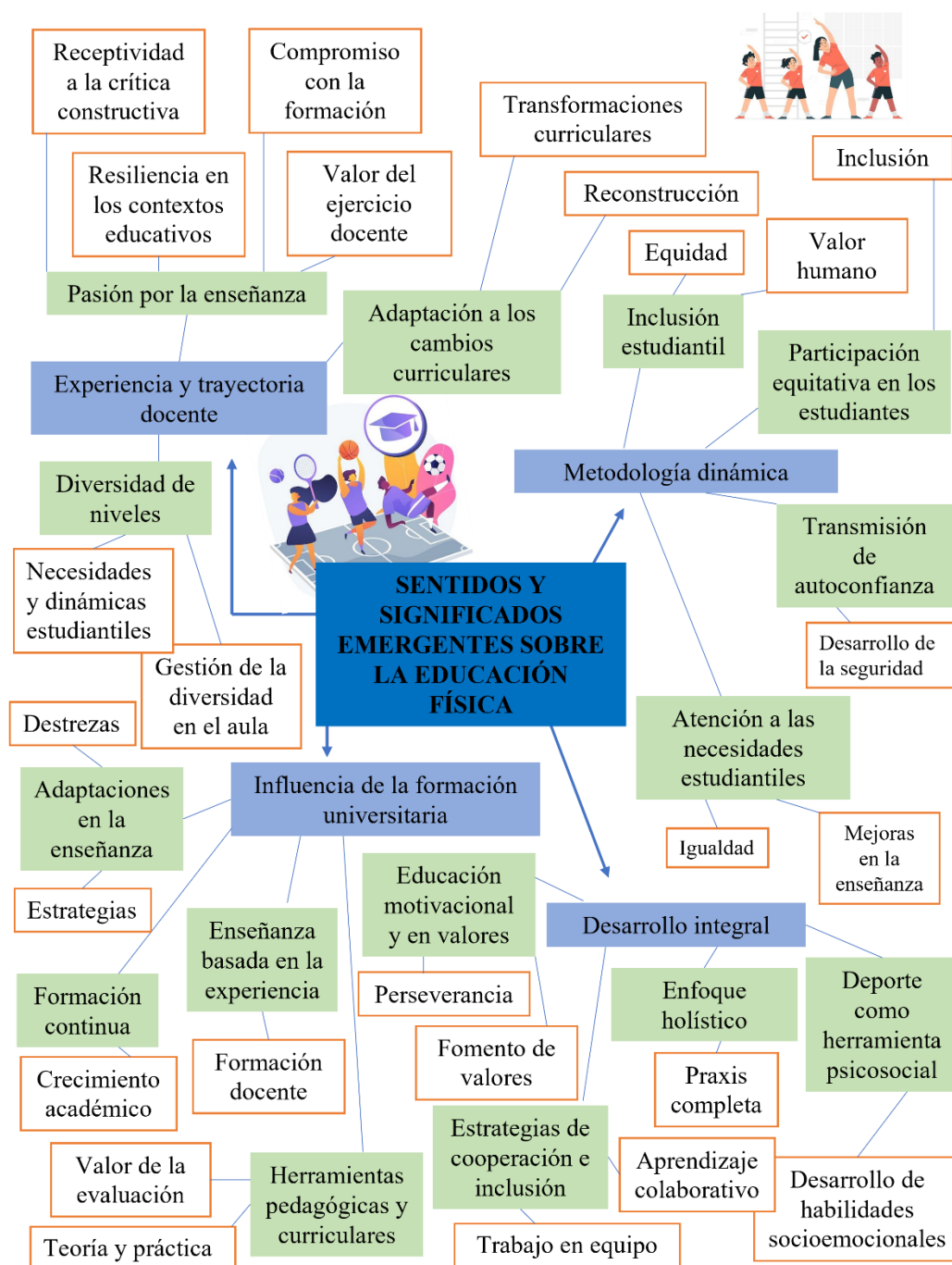
Figura 1. Relación entre las Categorías Orientadoras, Subcategorías y Dimensiones