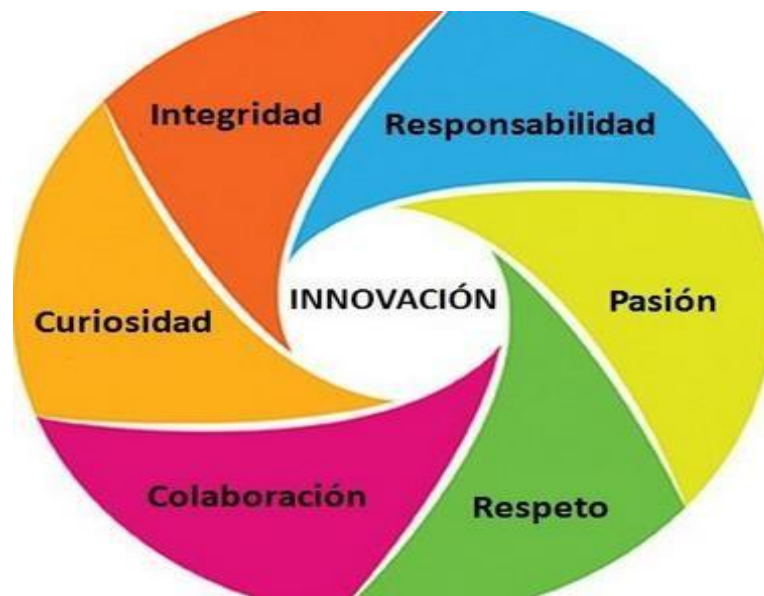
Gráfico 3: Propuesta Innovadora. Diagramación Bastidas (2020)

A continuación se presenta el gráfico como parte de incorporar en los valores del profesional de enfermería para las próximas investigaciones, siendo importante que la investigación es multicíclica o de desarrollo en espiral y obedece a una modalidad de diseño semiestructurado y flexible.