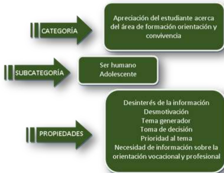
Gráfico 4. Apreciación del estudiante acerca del área de formación orientación y convivencia.

Por lo que se refiere a la Categoría 5: Formación del estudiante en el área de orientación vocacional y profesional, se crearon las siguientes Subcategorías Desarrollo de competencias, Instrucción Educativa del estudiante, Rendimiento del estudiante. Los estudiantes consultados opinaron que: “Trabajamos temas como el embarazo precoz, el alcoholismo, la delincuencia, el hostigamiento y las drogas realizando diversas actividades, “no hay un contenido específico, nos manda a realizar varias tareas y luego se discute” y “nos dan contenidos sobre cómo podemos mejorar en el nivel profesional, cuáles son nuestras debilidades y fortalezas, como convertir las debilidades en fortalezas y cómo actuar dependiendo de la situación”