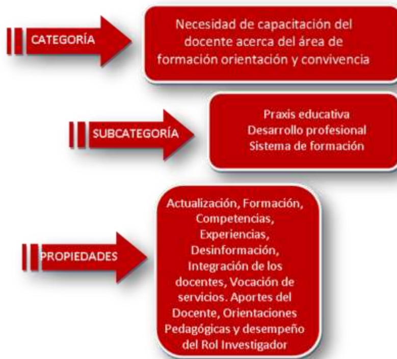
Gráfico 2. Necesidad de capacitación acerca del área de formación, orientación y convivencia.

A continuación, se presenta el gráfico correspondiente a la categoría 2 con sus subcategorías y propiedades que emergieron en la investigación.