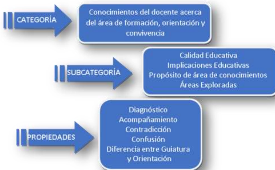
Gráfico 1. Conocimientos del área de formación, orientación y convivencia

La categoría 1 con sus respectivas subcategorías y propiedades se aprecia en el gráfico correspondiente.