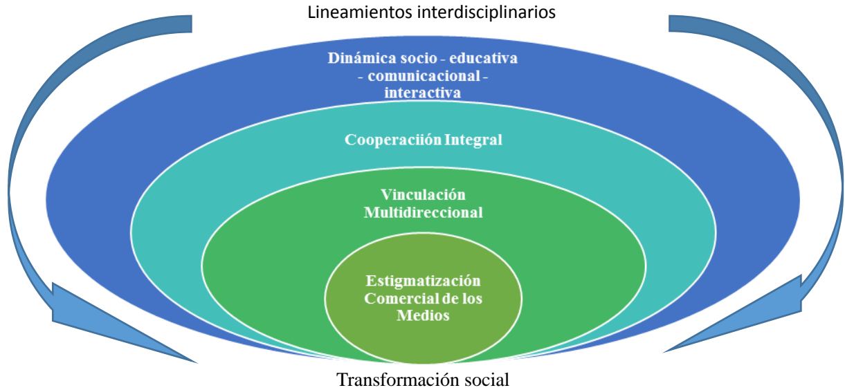
Gráfico N° 1. Síntesis Fenómeno Social Relevante