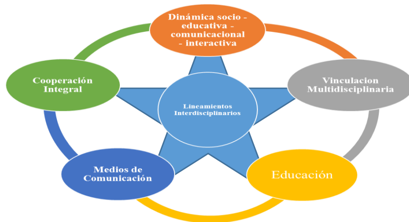
Gráfico N° 2. Proyección Teórica