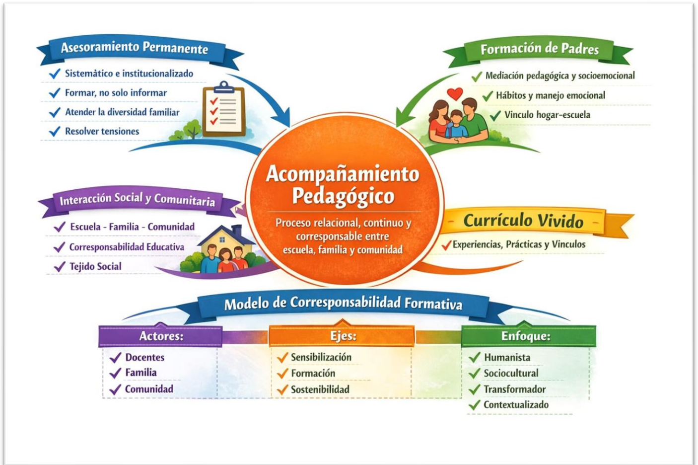
Figura 2 Esquema del Modelo teórico

Nota: Elaboración propia, apoyado en Chat GPT