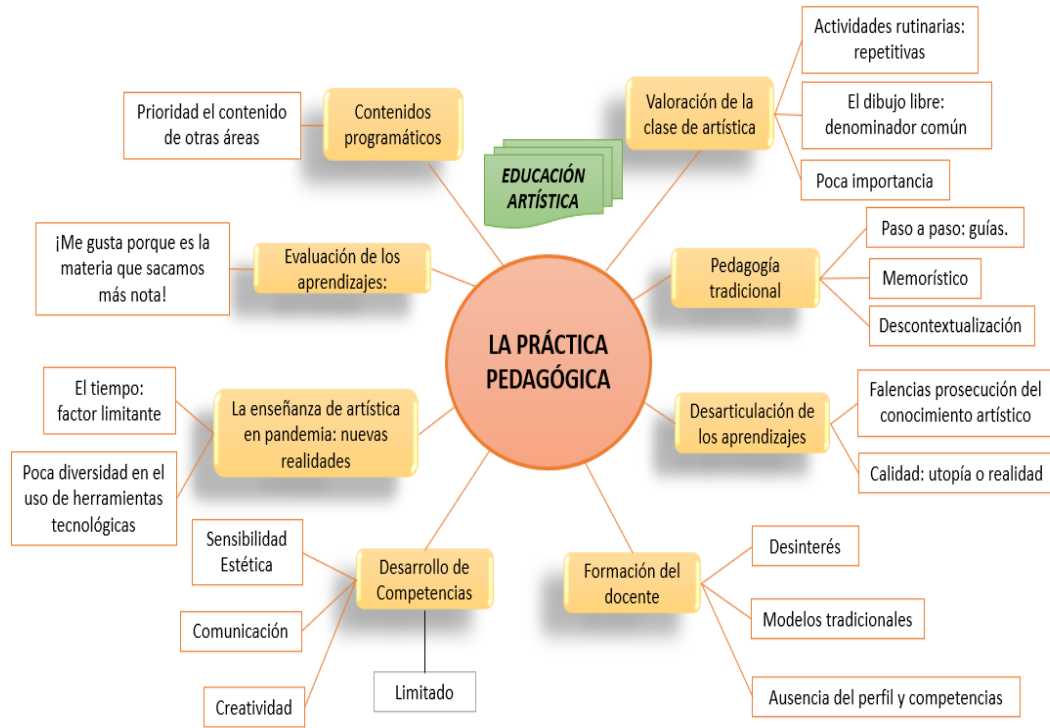
Gráfico 2. Representación de la Unidad Temática. La Práctica pedagógica de la Educación Artística.

los informantes de manera permanente narraron las falencias que se presentan día a día: falta de preparación del docente, pocas estrategias de enseñanza, práctica pedagógica tradicional y con esquemas memorísticos, repetitivos y muy poco creativos y un mínimo interés tanto de los docentes como de los estudiantes por las actividades que son consideradas como de relleno dentro del diseño curricular.